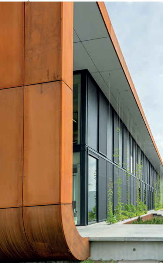
De langgerekte puien liggen verdiept in een kraag van 2 meter. Het overstek biedt schaduw.