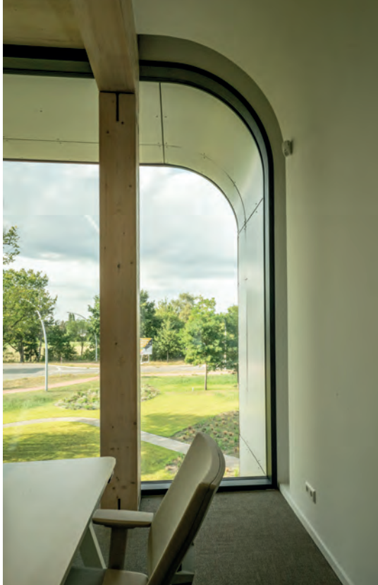
Aansluiting ronde kopgevel op houten CLT constructie.

Cortenstaal Dat het nieuwe kantoorgebouw grotendeels van hout is, is aan de buitenzijde niet direct te zien. De gebogen kopgevels en de kaders rondom de glazen voor- en achtergevel zijn gemaakt van cortenstaal en visu-