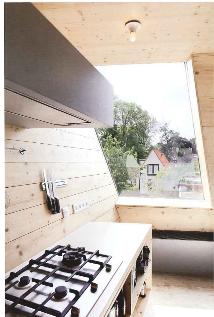
Om ruimte te winnen hebben de architecten het pand op de begane grond en de eerste verdieping laten uitkragen.

Holz. Vanwege de uitkraging viel houtskeletbouw af. Dan zou de uitkraging alleen met een stalen constructie te verwezenlijken zijn en zou het pakket te massief worden,' licht Baks toe. Uiteindelijk kwamen ze uit bij het volledig recyclebare Nur-Holz van Bouwpuur. Dat is een nieuw, ongelijmd massiefhouten paneelsysteem, ontwikkeld door de firma Rombach uit het Duitse Oberharmersbach en gemaakt van onbehandeld PEFC-gecertificeerd vuren uit het Zwarte Woud. Het hout wordt gekapt in de winter tijdens de rustperiode. Behalve de eetwinkel in Oegstgeest, het eerste publiek toegankelijke gebouw ter wereld in Nur-Holz, is er in Roosendaal een demowoning gebouwd.