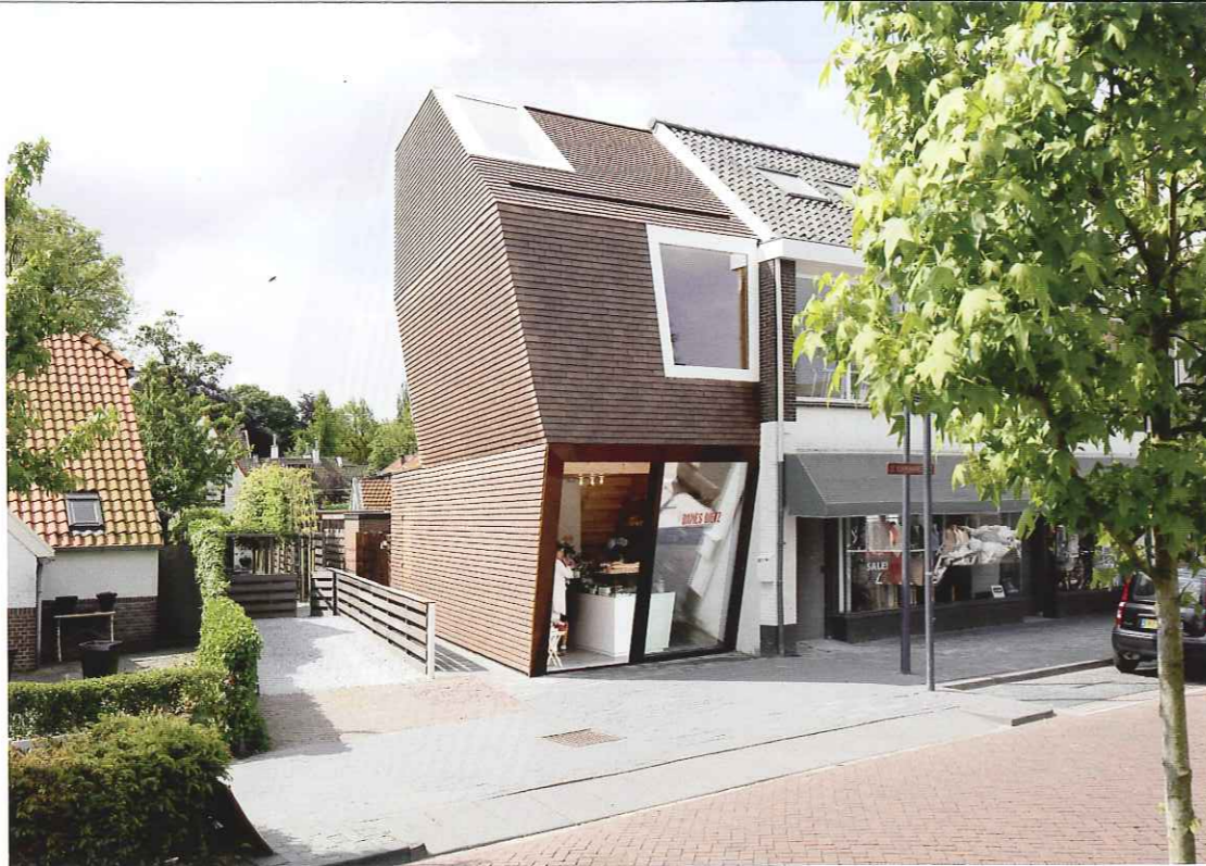
De eetwinkel is gesitueerd tussen een woonhuis uit het begin van de 20ste eeuw met recht van overpad en een pand uit de jaren 1970.